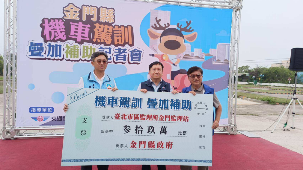
金門機車駕訓疊加全額免費 開放300個早鳥名額

為完善金門地區機車駕駛訓練環境，培養駕駛人遵守交通規則及正確駕駛習慣，降低機車肇事率，臺北市區監理所金門監理站去(112)年輔導轄區駕訓班完成普通重型機車班增設，金門縣政府並於今(113)年響應機車駕訓推廣政策，疊加補助每人1,300元，限量300人次，搭配交通部及駕訓班獎補助，今年前300名報名參加普通重型機車駕駛訓練，並考取駕照的民眾，將享有訓練費用「全額免費」優惠。