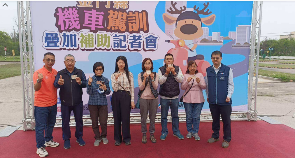
金門縣政府並於今(113)年響應機車駕訓推廣政策，疊加補助每人1,300元，限量300人次，搭配交通部及駕訓班獎補助，今年前300名報名參加普通重型機車駕駛訓練，並考取駕照的民眾，將享有訓練費用「全額免費」優惠。

金門地區機車駕駛訓練費用目前定價為2,850元，除交通部補助每人1,300元報名費用，金門縣政府今年加碼300名額疊加補助每人1,300元，駕訓班業者同時祭出每人獎勵金250元，讓每人共可獲2,850元獎補助金，意即可享有訓練費「全額免費」。另外，金門駕訓班亦籌備辦理「機車道路安駕訓練」，取得駕照參加機車道路安駕訓練者，將額外再補助1,200元，透過教練帶領學員實際道路駕駛，讓考取機車駕照的新手駕駛更快熟悉實際汽、機車混和車流道路環境，增進機車安全。